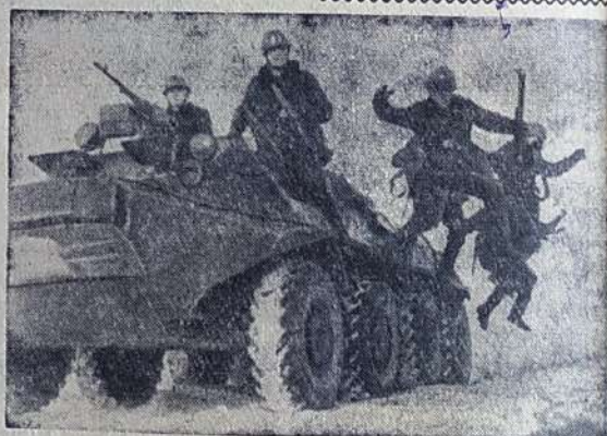
На снимке: по тревоге.

Собрались в перерыве дружья по цеху, разговорились. Затянулась сегодня беседа, вспомнили бывшие фронтовики боевые походы.