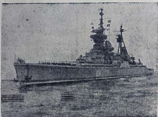
Краснознаменный Тихоокеанский Флот. Крейсер «Дмитрий Пожарский».