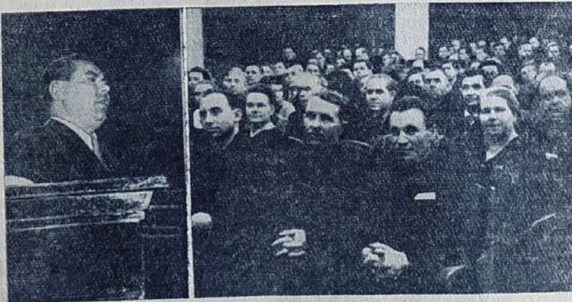
В городском театре состоялась встреча с кандидатом в депутаты Верховного Совета СССР тов. И. В. Капитоновым. На снимке: тов. И. В. Капитонов выступает перед избирателями.

Окружное предвыборное совещание представителей трудящихся единодушно приняло обращение к избирателям Серпуховского избирательного округа № 30 с призывом в день выборов, 16 марта, отдать свои голоса за И. В. Капитонова и А. Н. Туполева — верных сынов нашего народа.