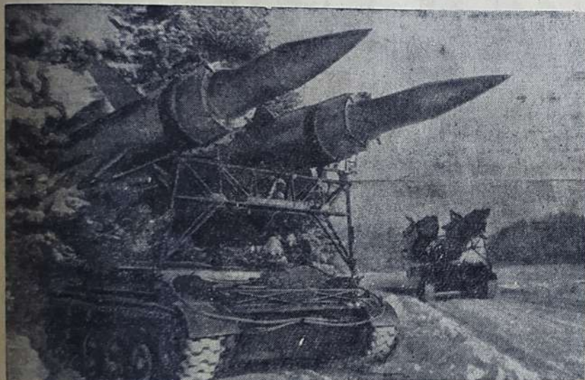
На снимке: подразделения ПВО сухопутных войск выходят в район стартовой позиции.

Советские Вооруженные Силы — надежный щит нашей Родины против всяческих происков империализма. Их мощь — могучее отрезвляющее средство против угара ревизионизма западно-германских неофашистов и всех, кто вновь бредит войной. Они являются надежным оплотом мира во всем мире.