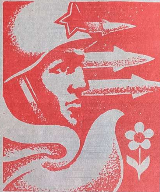
Плакат художника С. Шульца.

Завтра — День Советской Армии и Военно-Морского Флота